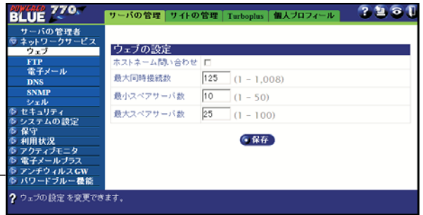
管理画面表示例 (Web ベース)